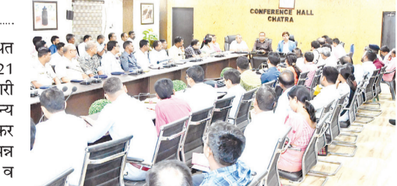
आयोजन होना है। जिसमे कुल 5148 अभ्यार्थी शामिल होंगे। झारखण्ड कर्मचारी चयन आयोग द्वारा जारी किए गए सभी निर्देशों का पूर्णतया अनुपालन कराने संबंधित कई आवश्यक दिशा निर्देश उपायुक्त द्वारा दिए गए।