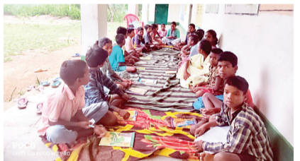
जमशेदपुर | परिचामी सिंहभूम जिला के हाटमन्दरिया और जगन्नाथपुर प्रखंड में, कम्प्यूटिनी और समेकित जन विकास केंद्र

जमशेदपुर संस्था द्वारा बच्चों के हित में एक महत्वपूर्ण परियोजना चलाई जा रही है। इस परियोजना में लगभग 900 बच्चों को बाल अधिकारों से जुड़ी विभिन्न विषयों पर जागरूक किया जा रहा है, जिनमें बाल विवाह, बाल हिंसा, लिंग आधारित हिंसा, यौन एवं स्वास्थ्य संबंधी जानकारी शामिल हैं। इस कार्यक्रम को प्रभावी ढंग से चलाने के लिए गाँवों में 12 पीर लीडर्स नियुक्त किए गए हैं। ये पीर लीडर्स बच्चों के साथ सत्र आयोजित कर उन्हें इन महत्वपूर्ण विषयों पर जानकारी देते हैं। कार्यक्रम में न केवल बच्चों की शिक्षा और जागरूकता पर ध्यान दिया जा रहा है, बल्कि माता-पिता भी इससे काफी संतुष्ट हैं। उनका मानना है कि ऐसे कार्यक्रमों से उनके बच्चों को सही जानकारी मिल रही है, जो उन्हें भविष्य में सही दिशा में आगे बढ़ने में मदद करेगी। यह पहल ग्रामीण क्षेत्रों में बच्चों के विकास और उनके अधिकारों के प्रति जागरूकता बढ़ाने का एक महत्वपूर्ण कदम है।