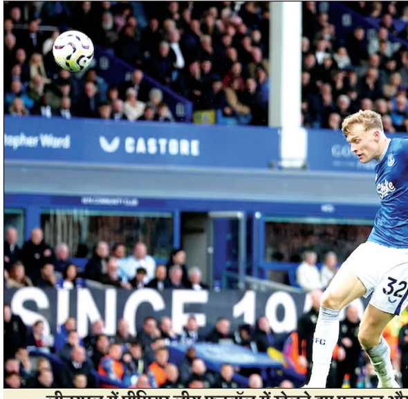
लीवरपूल में प्रीमियर लीग फुटबॉल में खेलते हुए एवर्टन और क्रिस्टल पैलेस के खिलाड़ी।

मुम्बई (ईएमएस)। अब इंडियन प्रीमियर लीग (आईपीएल) में नीलामी में खरीदे जाने के बाद उपलब्ध नहीं रहने वाले विदेशी खिलाड़ियों पर प्रतिबंध लगेगा। आईपीएल जनरल काउंसिल (आईपीएल जीसी) ने नीलामी में चुने जाने के बाद बिना किसी वैध कारण के नहीं खेलने वाले विदेशी खिलाड़ियों पर दो साल का प्रतिबंध लगेगा। हालांकि चोटिल होने या किसी और आवश्यक कार्य से बाहर रहने वाले खिलाड़ियों पर कार्रवाई नहीं होगी। आईपीएल जीसी की ओर से कहा गया, कोई भी खिलाड़ी जो नीलामी के लिए पंजीकरण करता है और नीलामी में चुने जाने के बाद सत्र की शुरुआत से पहले अपने को उपलब्ध नहीं बताता है तो उसे दो सत्र के लिए नीलामी में भाग लेने से प्रतिबंधित कर दिया जाएगा। वहीं अनफिट होने पर उसकी पुष्टि उसके घरेलू बोर्ड को करनी होगी तभी उसे सही माना जाएगा। प्रतिबंध के अलावा आईपीएल ने मिनी-नीलामी में खिलाड़ियों की फीस को विनियमित करने के लिए भी उपाय पेश किए हैं। विदेशी खिलाड़ियों को अब बाद की मिनी नीलामी में शामिल होन के लिए मेगा नीलामी में पंजीकरण करना होगा। यह नियम खिलाड़ियों को मिनी नीलामी में संभावित रूप से उच्च बोली हासिल करने के लिए मेगा नीलामी को छोड़ने से रोकता है। आईपीएल ने मिनी-नीलामी में विदेशी खिलाड़ियों के लिए अधिकतम शुल्क भी लागू किया है। यह सीमा 18 करोड़ रुपए की उच्चतम प्रतिभारण कीमत या पिछली मेगा नीलामी से उच्चतम नीलामी मूल्य, जो भी कम हो उस पर निर्धारित की जाएगी। इसका उद्देश्य मिनी नीलामी में खिलाड़ियों की कीमतों में वृद्धि को रोकना है, जहां टीमों अक्सर विशिष्ट स्क्वाड अंतराल को भरने के लिए प्रीमियम दरों का भुगतान करती हैं।