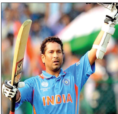
अंतरराष्ट्रीय स्तर का ही होगा। गावस्कर ने सचिन के खेलने को लेकर कहा कि वह हमेशा ही ताजगी से भरे रहते हैं। वह सिर्फ भारतीय नहीं, बल्कि हर क्रिकेट प्रेमी के दिल में बसते हैं। इसलिए उनके फिर से मैदान में उतरने को लेकर बहुत उत्साह और बेसब्री है, वह हर खेल को पूरी लगन से खेलते हैं, तो हम उम्मीद कर सकते हैं कि आगे कुछ रोमांचक पल देखने को मिलेंगे। गावस्कर ने कहा कि पहले सत्र के लिए केवल तीन स्थल रखे गये हैं पर जैसे-जैसे सीजन आगे बढ़ेंगे, और भी स्थानों पर आईएमएल का आयोजन हो सकेगा। गावस्कर ने कहा कि कमिश्नर के तौर मुझे ये देखना होगा कि लीग बिना किसी परेशानी के सुचारू रूप से चले। खिलाड़ियों को पता है कि उनसे क्या उम्मीद की जाती है और वे पर्याप्त अनुभवी हैं।

मुम्बई (ईएमएस)। भारतीय टीम के पूर्व कप्तान सुनील गावस्कर को इंटरनेशनल मास्टर्स लीग (आईएमएल) के लिए कमिश्नर बनाया गया है। फ्रेंचाइजी आधारित ये टी20 लीग इसी साल शुरू होगी। इसमें छह टीमों शामिल होंगी। ये टूर्नामेंट हर साल खेला जाएगा। इसमें भारत, ऑस्ट्रेलिया, दक्षिण अफ्रीका, वेस्ट इंडीज, इंग्लैंड और श्रीलंका के दिग्गज खिलाड़ी खेलते हुए दिखेंगे। इसमें लोगों को एक बार फिर सचिन तेंडुलकर की बल्लेबाजी देखने का अवसर फिर मिलेगा। इस लीग को लेकर गावस्कर बेहद उत्साहित हैं। उनका कहना है कि इससे पूर्व खिलाड़ियों में फिर से ऊर्जा आयेगी। उन्हें एक बार फिर से अपने देश के लिए खेलने का अवसर मिलेगा। ये टूर्नामेंट में