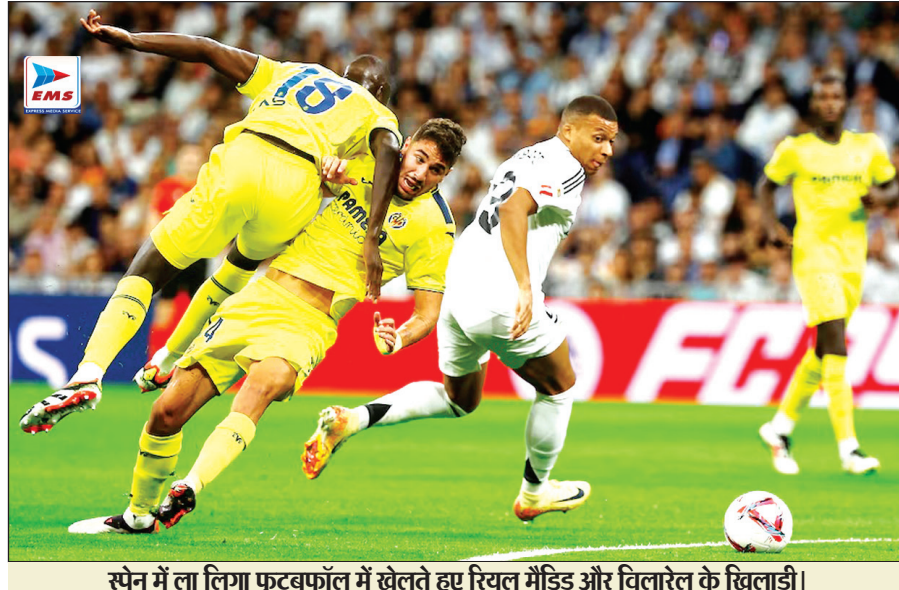
स्पेन में ला लिगा फुटबॉल में खेलते हुए रियल मैड्रिड और विलारेल के खिलाड़ी।

मुम्बई (ईएमएस)। ऑलराउंडर शिवम दुबे से एक शो दौरान कहा जब पूछा गया कि उनका पसंदीदा कप्तान कौन है तो शिवम ने एक ऐसा जवाब दिया जिसे सभी ने पसंद किया है। शिवम से महेन्द्र सिंह धोनी और रोहित शर्मा के के बारे में पूछा गया था। तब उनके जवाब से दर्शकों के साथ ही मेजबान और अन्य क्रिकेटर भी प्रभावित नजर आये शिवम ने इसके जवाब में कहा, "जब मैं चेन्नई के लिए खेलता हूँ, तो एमएस धोनी सर्वश्रेष्ठ होते हैं, वहीं जब मैं भारतीय टीम से खेलता हूँ तो रोहित शर्मा सर्वश्रेष्ठ होते हैं। शिवम चोटिल होने के कारण बांग्लादेश के खिलाफ टी20 सीरीज से बाहर हैं। उनकी पीट में चोट लगी थी, जिसके कारण उन्हें पूरी सीरीज से बाहर होना पड़ा। भारतीय क्रिकेट बोर्ड (बीसीसीआई) ने उनके स्थान पर तिलक वर्मा को शामिल किया है। दुबे अभ्यास सत्र के दौरान चोटिल हो गए थे। चोट के कारण वे ईग्रीन कप के लिए मुंबई की टीम से भी बाहर हो गए। हालांकि उनकी चोट की गंभीरता स्पष्ट नहीं है, लेकिन टीम प्रबंधन ने उनकी स्थिति को और खराब होने से बचाने के लिए सतर्क रख अपनाया है।