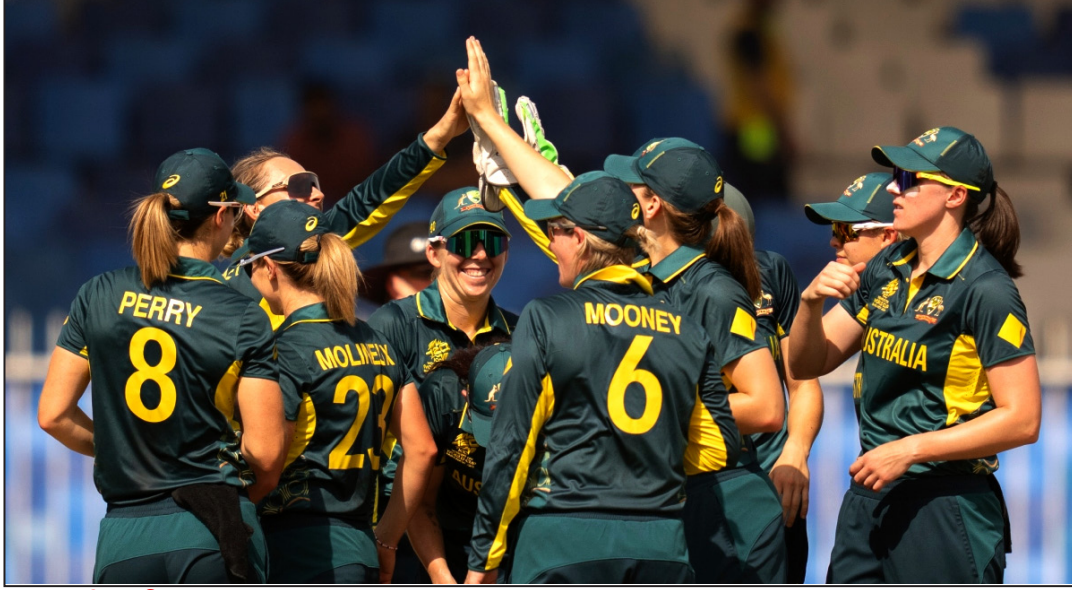
टी20 विश्व कप : क्रिकेट टीम को टी20 विश्व कप के अपने श्रीलंकाई महिला दूसरे मैच में भी हार का सामना करना पड़ा है। श्रीलंकाई टीम को गत विजेता ऑस्ट्रेलिया टीम ने हराया है। इस मुकाबले में श्रीलंकाई