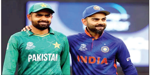
सबसे महान बल्लेबाजों में से एक के रूप में अपनी विरासत को मजबूत किया है। आईसीसी इवेंट से लेकर तीनों प्रारूपों में उनका प्रदर्शन बेहतर

नई दिल्ली (ईएमएस)। बाबर आजम या विराट कोहली, कौन है बेहतर बल्लेबाज? यह सवाल हमेशा उठता है लेकिन जब भी सवाल पर चर्चा होती है, तब फैसले के बीच हमेशा जुनून देखने को मिलता है। अब इस सवाल का जवाब पाकिस्तान की पूर्व कप्तान सिदरा नवाज ने दिया है। नवाज ने कहा, मुझे दोनों पसंद हैं, लेकिन व्यक्तिगत रूप से मैं कोहली को चुनती हूँ। कोहली ने खेल के इतिहास में शायद