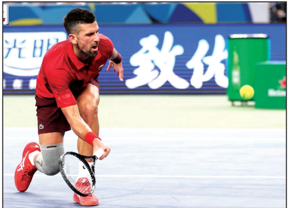
शंघाई में एटीपी टूर में रिटर्न शॉट लगाते हुए सर्बिया के नोवाक जोकोविच।

दुबई (ईएमएस)। पाकिस्तान की महिला क्रिकेट टीम ने भारतीय टीम को जीत के लिए 106 रन का लक्ष्य दिया है। इस मैच में पाक टीम ने टॉस जीतकर पहले बल्लेबाजी करते हुए 20 ओवर में 8 विकेट पर 105 रन बनाये। पाक टीम की बल्लेबाज इस मैच में भारतीय गेंदबाजों के सामने दबाव में रही। केवल निदा डार ही 28 रन बना पायीं। अधिकतर खिलाड़ी दो अंकों तक भी नहीं पहुंच पायीं। वहीं भारतीय टीम की ओर से अरुंधति रेड्डी ने 3 जबकि श्रेयंका पाटिल ने 2 विकेट लिए। वहीं रेणुका ठाकुर, दीपति शर्मा, आशा सोभना ने एक-एक विकेट लिया।