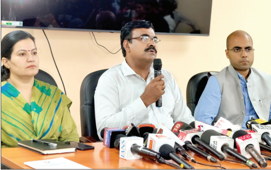
चुनाव आयोग आदर्श आचार संहिता का पालन सुनिश्चित करेगा। स्वतंत्र, निष्पक्ष और शांतिपूर्ण चुनाव हमारी प्राथमिकता होगी। शहरी क्षेत्रों में मतदान प्रतिशत बढ़ाना भी हमारी प्राथमिकता सूची में है। मुख्य निर्वाचन