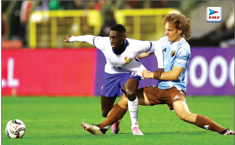
बूसेल्स में यूईएफए नेशंस लीग फुटबॉल में खेलते हुए खिलाड़ी।