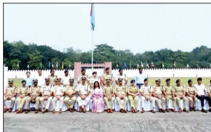
अपराध अनुसंधान विभाग सहित शवान दस्ता की टीमों भाग ले रही है. परीक्षा के बाद परीक्षक मंडल द्वारा सभी विषयों पर उत्कृष्ट प्रतिभागियों का चयन कर एक राज्य स्तरीय टीम का गठन किया जाएगा.

रांची : डोरंडा स्थित जैप 1 में मंगलवार को 19 वीं झारखंड राज्य पुलिस इयूटी मीट का उद्घाटन हुआ है. सीआईडी के द्वारा आयोजित कराए जा रहे इयूटी मीट का गृह सचिव वंदना दादेल और डीजीपी अनुराग गुप्ता ने उद्घाटन किया. चार दिन तक चलने वाले पुलिस इयूटी मीट में इंसपेक्टर और सब इंसपेक्टर के लिए विधि विज्ञान परीक्षा (लिखित), मेडिको लीगल परीक्षा, पुलिस फोटोग्राफी, क्राइम इन्वेस्टीगेशन लॉ रूल्स और कोर्ट जजमेंट, विज्ञान प्रायोगिक और मौखिक परीक्षा होगी. इस चार दिवसीय राज्य स्तरीय पुलिस इयूटी मीट में दक्षिणी छोटानागपुर क्षेत्र, रांची, कोयला क्षेत्र, बोकारो, संथाल परगना क्षेत्र, दुमका, उत्तरी छोटानागपुर क्षेत्र, हजारीबाग, पलामू क्षेत्र, डालतनगंज, कोल्हाण क्षेत्र, चाईबासा और