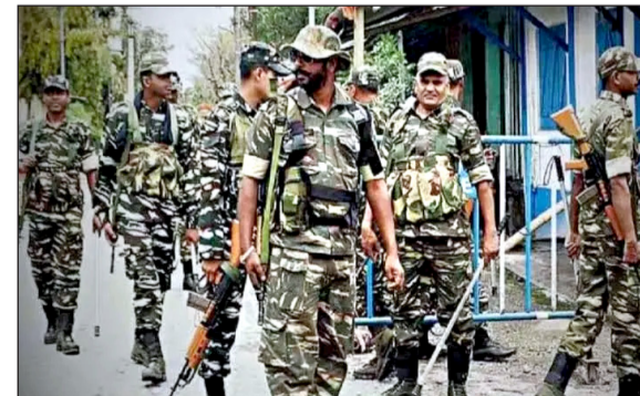
नई दिल्ली : झारखंड में विधानसभा चुनाव का बिगुल बज गया है। नक्सल प्रभावित राज्य में दो चरणों के तहत चुनाव होंगे। पहले चरण का मतदान 13 नवंबर को होगा, जबकि दूसरे चरण की वोटिंग 20 नवंबर को होगी। चुनाव के नतीजे 23 नवंबर को आएंगे। निष्पक्ष एवं शांतिपूर्ण तरीके से चुनाव संपन्न कराने के केंद्रीय अर्धसैनिक बलों को बड़ी जिम्मेदारी सौंपी गई है। झारखंड के नक्सल प्रभावित क्षेत्रों में विधानसभा चुनाव के दौरान कोई अप्रिय घटना न हो और बिना किसी भय के लोग, चुनाव प्रक्रिया में भाग ले सकें, इसके लिए केंद्रीय गृह मंत्रालय ने अर्धसैनिक बलों के करीब 10000 जवानों की अग्रिम तैनाती कर दी है। केंद्रीय अर्धसैनिक बलों में सीआरपीएफ की

की गई है। केंद्रीय गृह मंत्रालय ने गत सप्ताह ही झारखंड सरकार के मुख्य सचिव, गृह सचिव और डीजीपी को सूचित किया है। निर्वाचन आयोग के दिशा निर्देशों के मुताबिक, यह निर्णय लिया गया है कि झारखंड विधानसभा चुनाव में केंद्रीय अर्धसैनिक बलों को सौंपे गए क्षेत्रों में सीआरपीएफ की तैनाती का डिटेल्ड प्लान तैयार करें। इस मामले में संबंधित फोर्स और चीफ फोर्स कोर्डिनेटर के साथ चर्चा की जाएगी। केंद्रीय बलों की मूवमेंट और डेपलॉयमेंट के समन्वय को जिम्मेदारी सीआरपीएफ को सौंपी गई है। चुनावी इयूटी के लिए आ रहे केंद्रीय बलों की मूलभूत जरूरतों का ध्यान रखा जाए। सीआरपीएफ से कहा गया है कि वह सीआरपीएफ के साथ चर्चा की जाएगी। केंद्रीय बलों को झारखंड के विभिन्न क्षेत्रों में एरिया डोमिनेशन, विश्वास बहाली के उपाय, फ्लैग मार्च और सर्विलांस का काम सौंपा गया है। केंद्रीय अर्धसैनिक बलों की निर्धारित कंपनियों 14 अक्टूबर को अपने ड्यूटी स्थल पर पहुंच गई हैं। केंद्रीय बलों की मूवमेंट और डेपलॉयमेंट के समन्वय को जिम्मेदारी सीआरपीएफ को सौंपी गई है। चुनावी इयूटी के लिए आ रहे केंद्रीय बलों की मूलभूत जरूरतों का ध्यान रखा जाए। सीआरपीएफ से कहा गया है कि वह सीआरपीएफ के साथ चर्चा की जाएगी। केंद्रीय बलों की मूवमेंट और डेपलॉयमेंट के समन्वय को जिम्मेदारी सीआरपीएफ को सौंपी गई है। चुनावी इयूटी के लिए आ रहे केंद्रीय बलों की मूलभूत जरूरतों का ध्यान रखा जाए। सीआरपीएफ से कहा गया है कि वह सीआरपीएफ के साथ चर्चा की जाएगी। केंद्रीय बलों की मूवमेंट और डेपलॉयमेंट के समन्वय को जिम्मेदारी सीआरपीएफ को सौंपी गई है।