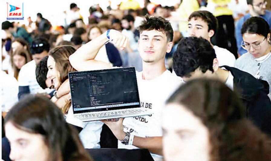
लिसबन में छात्र गिनीज बुक रिकार्ड के लिए सबसे बड़, कम्प्यूटर प्रोग्रामिंग के एक इवेंट में भाग लेते हुए।