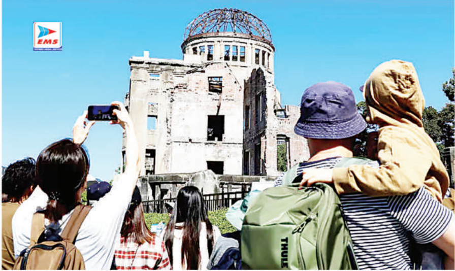
जापान में लोग हिरोशिमा पीस मैमोरियल पार्क में एटम बम डोम को देखते हुए।

समुदाय पर हमले की कई खबरें सामने आई हैं। दुर्गा पूजा के दौरान ही कई मंदिरों पर हमले और चोरी हुई हैं। पहली घटना ढाका के तांतीबाजार में शुक्रवार रात को एक शख्स ने दुर्गा पंडाल में बम फेंका। हालांकि बम फटा नहीं। पंडाल की सिव्योरिटी में लगे लोगों ने आरोपी को पकड़ने की कोशिश की तो उसे बचाने काई लोग आए। इन्होंने आरोपी को बचाने के लिए चाकूबाजी शुरू कर दी। इसमें 5 लोग घायल हो गए। दूसरी घटना बांग्लादेश के जेशोरेश्वरी मंदिर से मां काली का मुकुट चोरी हो गया। यह सोने की परत चढ़ा चांदी का मुकुट है। इस घटना का सीसीटीवी फुटेज सामने आया। पीएम मोदी 2021 में बांग्लादेश दौरे के दौरान जेशोरेश्वरी मंदिर दर्शन के लिए गए थे। इस दौरान उन्होंने यह मुकुट मंदिर में चढ़ाया था।