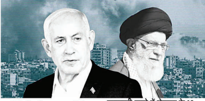
जाएगी कि ईरान के 1 अक्टूबर को किए गए हमले पर पलटवार कैसे करें। इससे पहले शुक्रवार को भी एक बैठक हुई थी। हालांकि, उसमें कोई फैसला नहीं हो पाया था।

तेलअवीव (ईएमएस)। ईरान ने हिजबुल्लाह चीफ हसन नसरल्लाह की मौत का बदला लेने के लिए 1 अक्टूबर को इजराइल पर 200 मिसाइलें दागी थीं। अमेरिका को शक है कि इसका बदला लेने के लिए इजराइल अब ईरान के सैन्य ठिकानों को निशाना बना सकता है। रिपोर्ट के मुताबिक अमेरिका को नहीं लगता कि इजराइल पलटवार में ईरान के न्यूक्लियर ठिकानों को निशाना बनाएगा। हालांकि, ईरान के एनर्जी इंफ्रास्ट्रक्चर पर अटैक की आशंका भी जताई गई है। वहीं, ईरान ने अमेरिका और मिडिल ईस्ट के कुछ देशों को कहा है कि अगर इजराइल ने हमला किया तो वे जवाब जरूर देंगे। ईरान से तनातनी के बीच नेतृत्वाहू आज फिर से कैबिनेट की मीटिंग करेंगे। इसमें ये चर्चा की