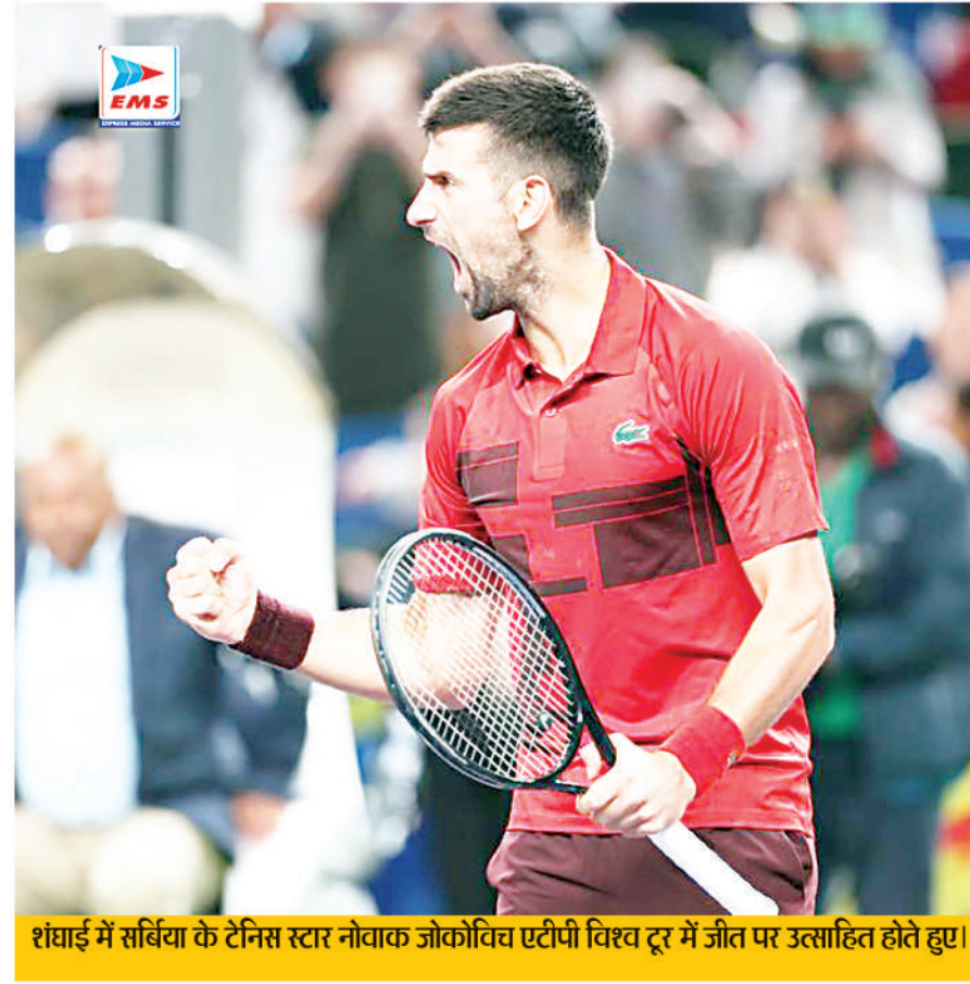
शंघाई में सर्बिया के टेनिस स्टार नोवाक जोकोविच एटीपी विश्व टूर में जीत पर उत्साहित होते हुए।