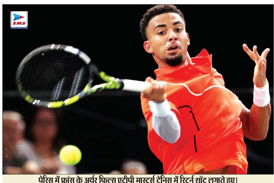
पेरिस में फ्रांस के अर्चुर फिल्स एटीपी मास्टर्स टैनिंस में रिटर्न शॉट लगाते हुए।

होगा। वहीं स्टार तेज गेंदबाज जसप्रीत बुमराह मुंबई इंडियंस इतिहास के सबसे महंगे खिलाड़ी बन गए हैं। उन्हें फ्रेंचाइजी ने 18 करोड़ में रिटेन किया। मुम्बई ने इससे पहले ऑस्ट्रेलिया के ऑलराउंडर कैमरन ग्रीन को पिछली बार 17.50 करोड़ में खरीदा था। फ्रेंचाइजी ने ग्रीन को आईपीएल 2023 में अपने साथ जोड़ा था। गुजरात टाइटंस ने राशिद खान को 18 करोड़ में रिटेन किया। राशिद गुजरात टाइटंस के इतिहास के सबसे महंगे खिलाड़ी बन गए हैं। राशिद को इस फ्रेंचाइजी ने आईपीएल 2022 ऑक्शन में 15 करोड़ में खरीदा था। इसके अलावा ऋगुराज गायकवाड़ को चेन्नई सुपरकिंग्स ने रिटेंशन में 18 करोड़ में रिटेन किया। संजु सैमसन और यशस्वी जायसवाल को राजस्थान रॉयल्स ने 18-18 करोड़ में रिटेन किया।