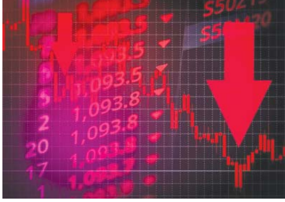
निफ्टी को 24,500 के स्तर को पार करना होगा। एंजेल वन के

नई दिल्ली, (ईएमएस)। सॉफ्टवेयर कंपनियों में बिकवाली और विदेशी संस्थानों की निरंतर बिकवाली के कारण महीने के आखिरी दिन घरेलू शेयर बाजार गिरावट के साथ बंद हुआ। बीएसई सेंसेक्स 553 अंक या 0.69 फीसदी की गिरावट के साथ 79,389 पर बंद हुआ, जबकि नेशनल स्टॉक एक्सचेंज का निफ्टी 50 इंडेक्स 135.5 अंक या 0.56 फीसदी की गिरावट के साथ 24,205.35 पर बंद हुआ। अक्टूबर के महीने में निफ्टी में 6 फीसदी से अधिक की गिरावट आई, जो पिछले साढ़े चार सालों में किसी भी महीने